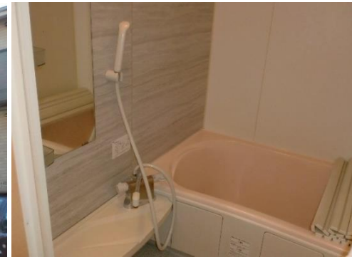
浴室(お部屋により色は異なります)